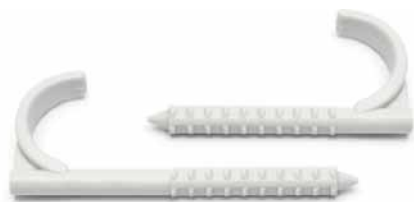
N1x32/75 ▪ N1x32/95

Sind für eine schnelle und einfache Montage der Rohre, Kabelleitungen, Schutzrohrleisten usw. bestimmt. Die Montage erfolgt in ein vorgebohrtes Bohrloch mit D 8 mm mithilfe des Einschlagwerkzeugs. Hergestellt aus PA mit Wärmebeständigkeit max. 130 °C.