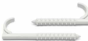
N1x25/75 ▪ N1x25/95