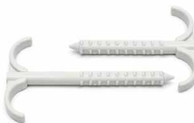
N2x25/75 ▪ N2x25/95