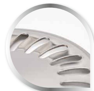
Rostfreies Gitter 1,5 mm